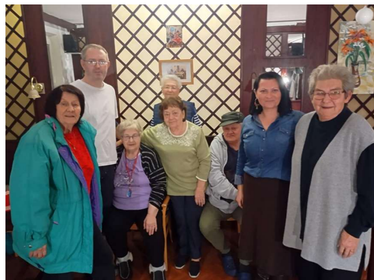
redakčná rada Našich novín

Rovnako za zamestnancov, ale i prijímateľov zo ZPS sa chceme poďakovať chlapcom z prevádzkového úseku za technickú pomoc a ochotu vždy pomôcť a taktiež za prípravu chutnej kapustnice na zamestnaneckom posedení, ale aj pri vianočnom posedení v ZPS. Sme radi, že vás máme.