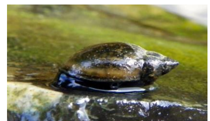
pripravili klienti 1. úseku

Aj slimáky majú svoj diel na úmrtí ľudí. Spôsobujú totiž bilharziózu (schistosomiázu), t.j. ochorenie vyvolané parazitmi, ktoré napádajú najmä močový mechúr, črevo, pečeň, pľúca a mozog. Príznakmi býva najskôr svrbivá vyrážka a vysoké horúčky. Ročne podľahne tejto chorobe podľa WHO asi 20 000 až 100 000 osôb.