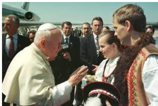
pápež Ján Pavol II. v Bratislave

Záujem o prvého slovanského pápeža neútlmilo ani po jeho smrti, napríklad jeho pohrebu sa zúčastnilo 200 hláv štátov bez rozdielu vyznania aj politickej príslušnosti. V rekordnom čase, už po 87 dňoch od úmrtia, začal proces blahorečenia (beatifikácie), ktorého sa dočkal už v máji 2011. Za svätého bol Ján Pavol II. vyhlásený v apríli 2014, cirkev mu pripisuje dve zázračné uzdravenia: francúzskej mnišky trpiacej Parkinsonovou chorobou a ženy, ktorá sa vyliečila v deň jeho beatifikácie.